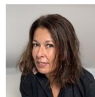
Céline Futur of work