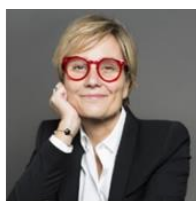
Carole Donner du leadership