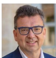
Bruno Donner du sens